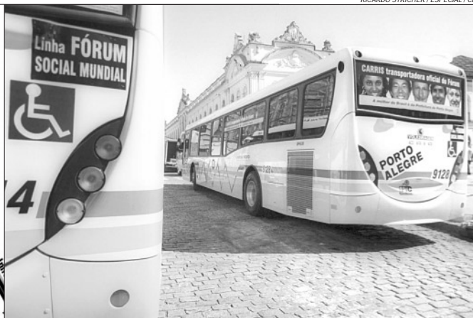
Carris apresentou seus novos veículos