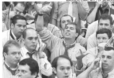
Analistas prevêem cenário excepcional para emergentes

Por aqui, o indicador mais aguardado é o IPCA-15 de dezembro, na quarta-feira. O índice pode dar pistas do rumo da taxa básica de juros (Selic). Se vier baixo, pode reforçar a hipótese de corte de 0,50 ponto percentual na taxa na primeira reunião do ano do Comitê de Política Monetária (Copom), em janeiro. Se vier alto, pode indicar redução de 0,25 ponto.