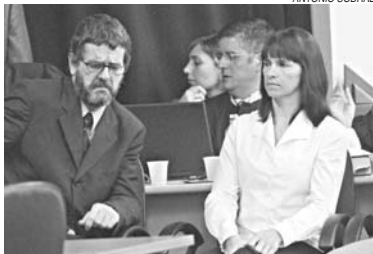
Acusado acompanhou o júri ao lado da ex-empregada

para o Presídio Central, onde estava detido preventivamente há dois anos e meio.