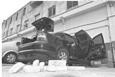
Droga estava escondida entre a lata e o forro do carro